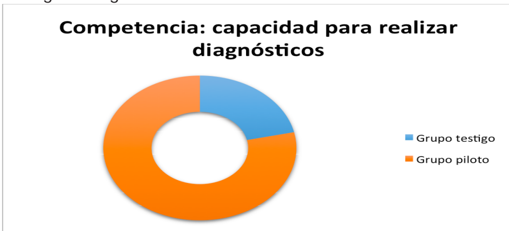
Gráfico 3: Resultados directos que reflejan el grado de dominio de la competencia.

En relación a los datos recogidos de la observación participante, de hechos objetivos que reflejan que se está trabajando la competencia para la realización de diagnósticos, se hizo un conteo de la misma y se puede observar que entre el GT y el GP hay una diferencia significativa. Se considera que tiene un impacto muy positivo en el GP las asesorías y el acompañamiento que reciben los alumnos. Así lo muestra el gráfico siguiente.