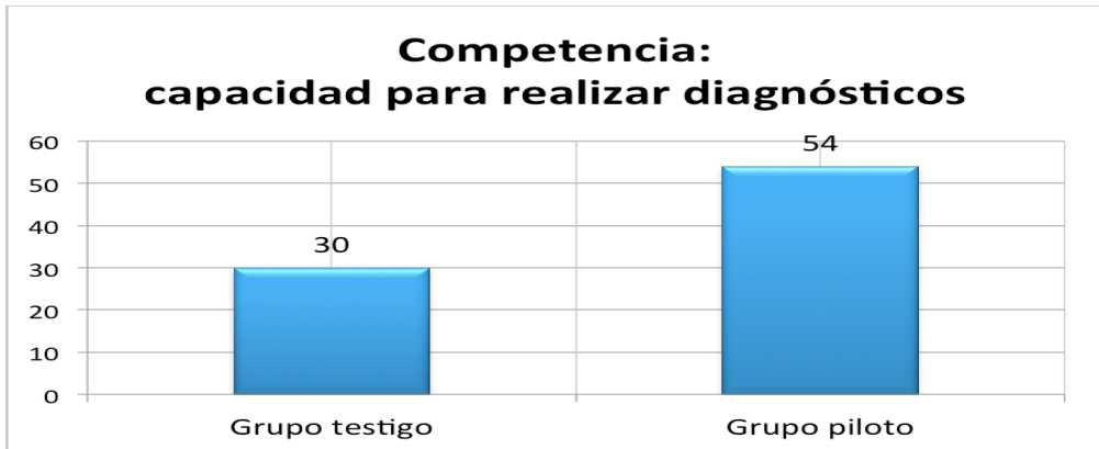
Gráfico 1: Resultados directos que reflejan el grado de dominio de la competencia.

La siguiente gráfica muestra las referencias que se hicieron directamente en el GD tanto del GT y del GP, considerando estas como un señalamiento directo en cómo ser hacia el diagnóstico, eliminándose aquellas palabras sueltas referentes al diagnóstico, vgr. “yo si he realizado un diagnóstico”, frases que no daban parámetros para establecer un valor de dominio.